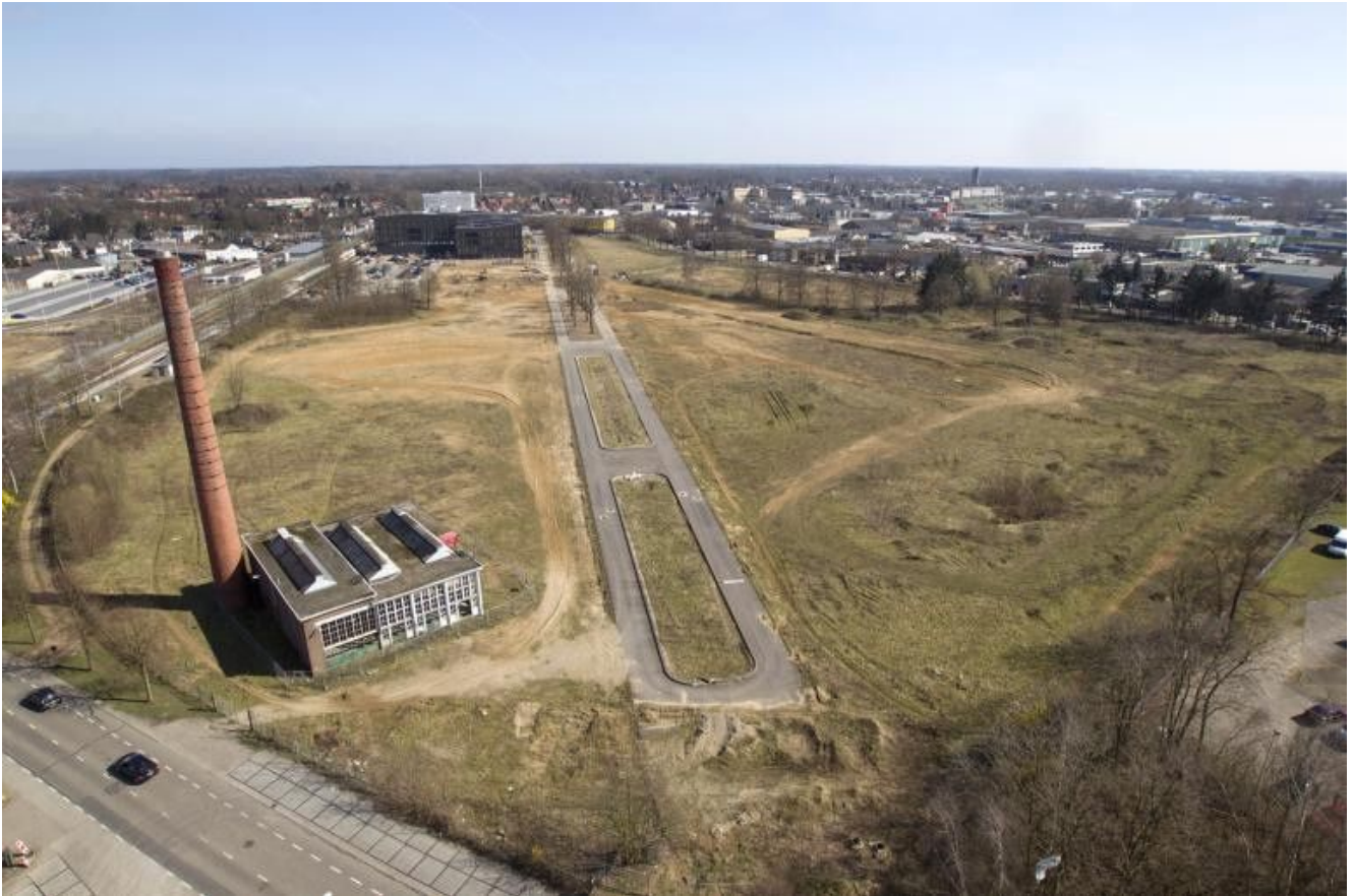
De contouren van de huidige Hamburgerbroeklaan en Ketelhuis zijn al zichtbaar